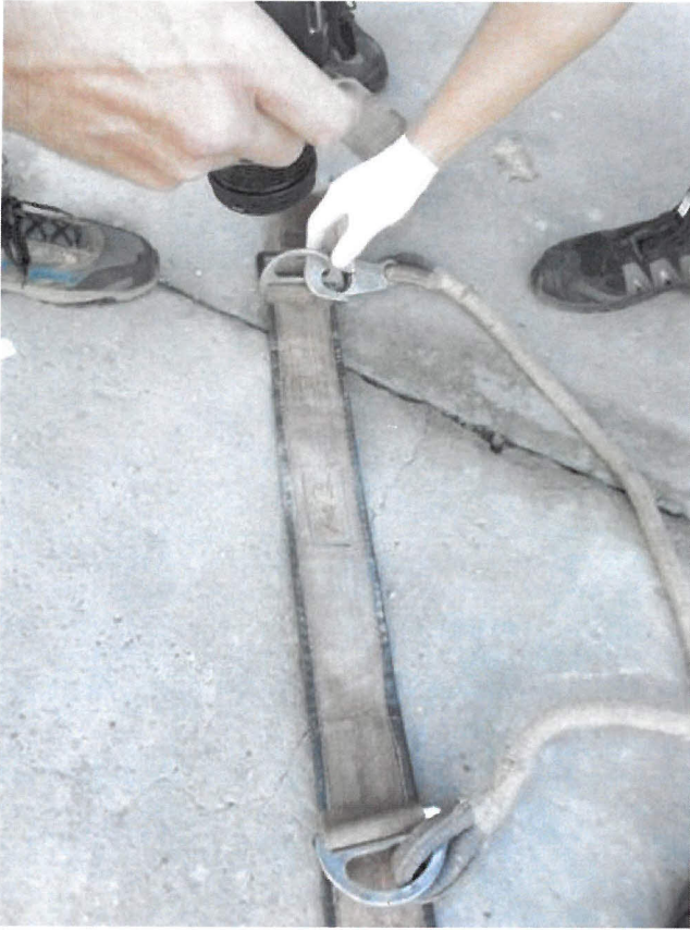
Obrázek 15 - postroj použitý zam stnancem