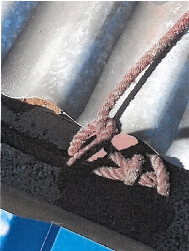
Obrázek 12 - detail kotevního bodu ve hřebeni stěchy