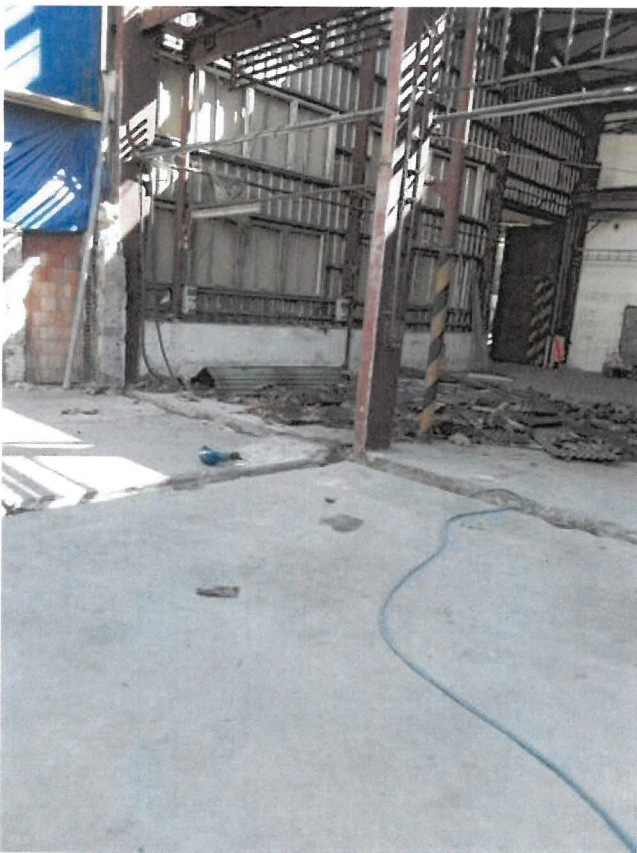
Obrázek 4 - místo dopadu