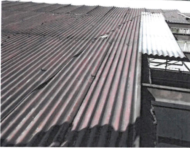
Obrázek 7 - pohled na pracovišt s nataženým kotevním lanem