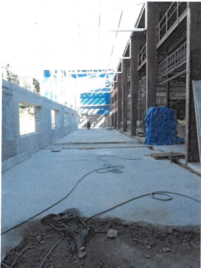
Obrázek 1 - pohled 1. do upravované části haly