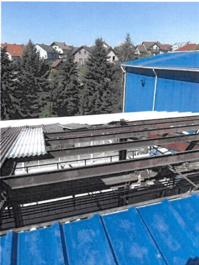
Obrázek 6 - pohled na pracoviště - demontovaná část stěšního pláště