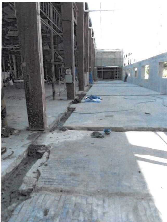
Obrázek 2 - pohled 2. do upravované části haly