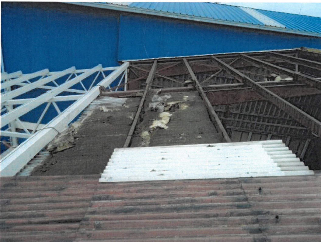
Obrázek 10 - 2. pohled na pracovišt - sendvi ová skladba demont.. st eš. pl. - spodní plechy a část tep. izol, v míst propadu