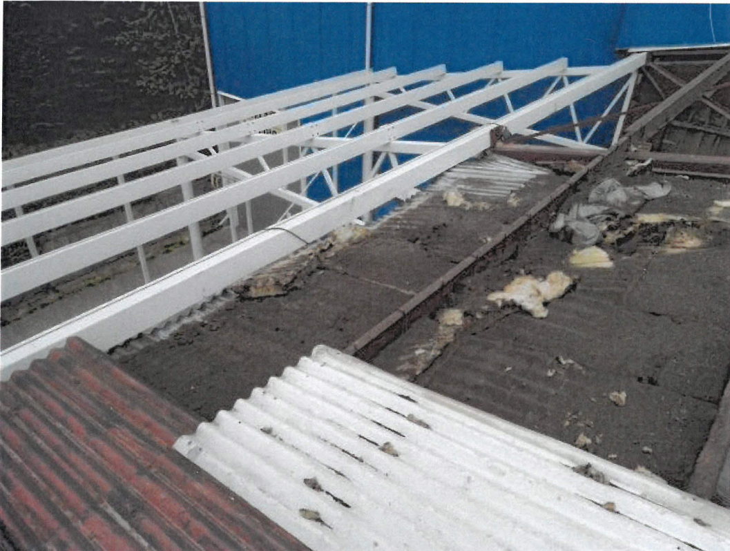
Obrázek 9 - 1. pohled na pracovišt - sendvi ová skladba demont.. st eš. pl. - spodní plechy a část tep. izol, v míst propadu