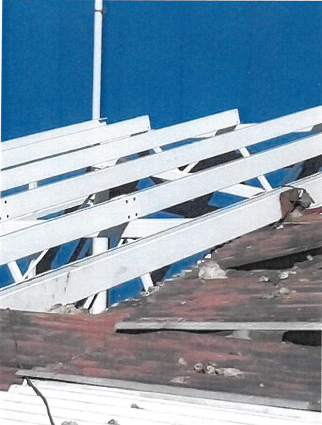
Obrázek 11 - detail místa propadu - pohled ze stěchy