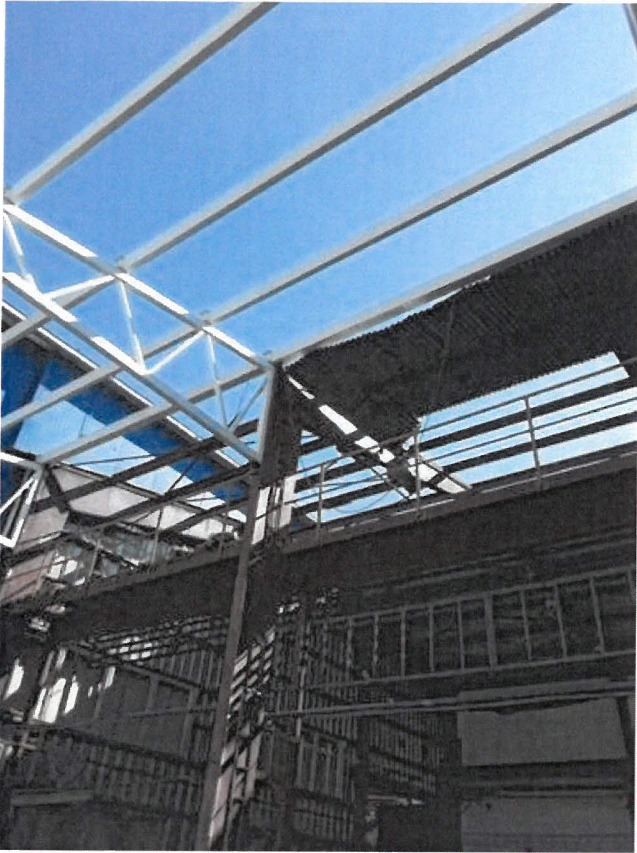
Obrázek 3 - místo propadu - pohled z haly