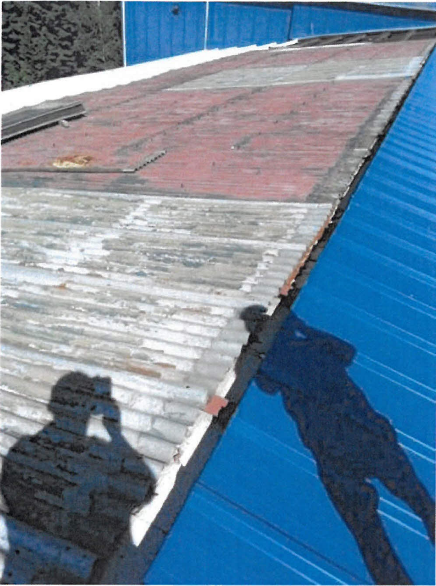
Obrázek 5 - pracoviště na stěše - styk nové a staré stěchy