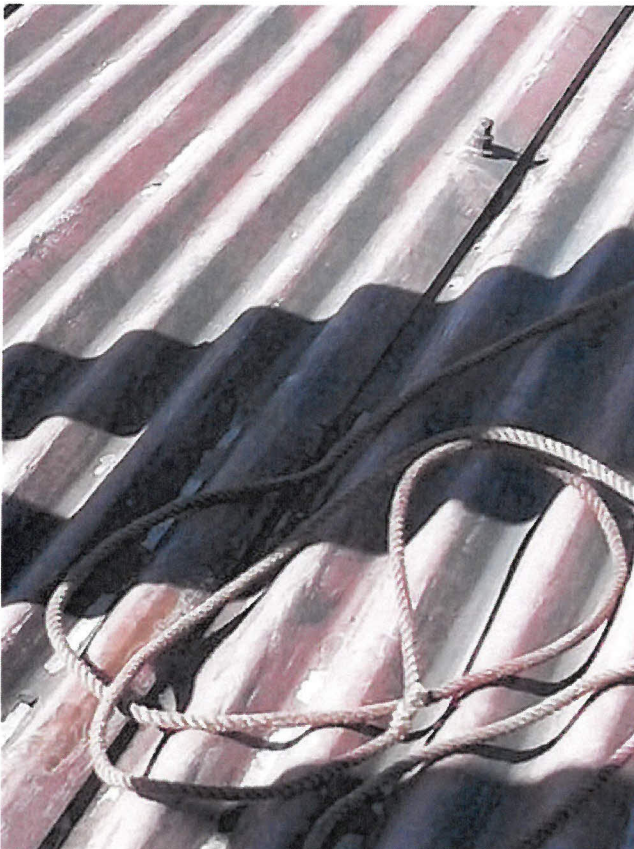
Obrázek 14 - detail kotevního lana