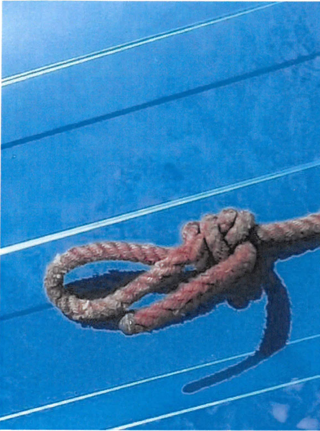
Obrázek 13 - kotevní lano - konec pro uchycení postroje